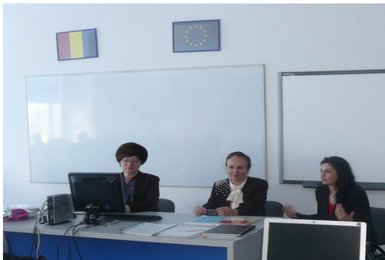
Figură 4 Workshop pe PROIECT în 2013