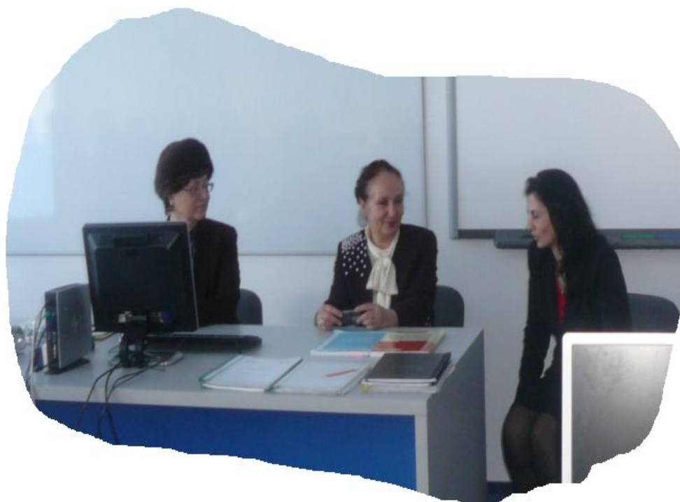
Figură 5 Experienta împartășită!