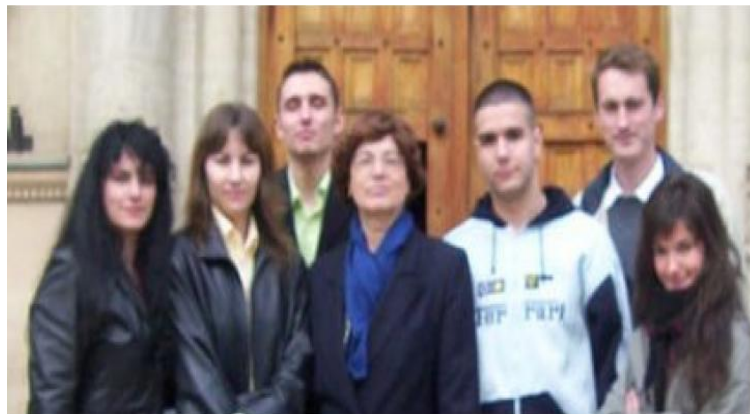
Figură 3. Cu studentii premiați la Simpozionul francofon 4

Si „ diplomele de excelenta „ pe care tocmai le-au primit dau „ aripa „ gandarilor. Noi chiar am “lucrat “ aceste idei de afaceri cu Microsoft Project la Managementul Proiectelor Europene . 3