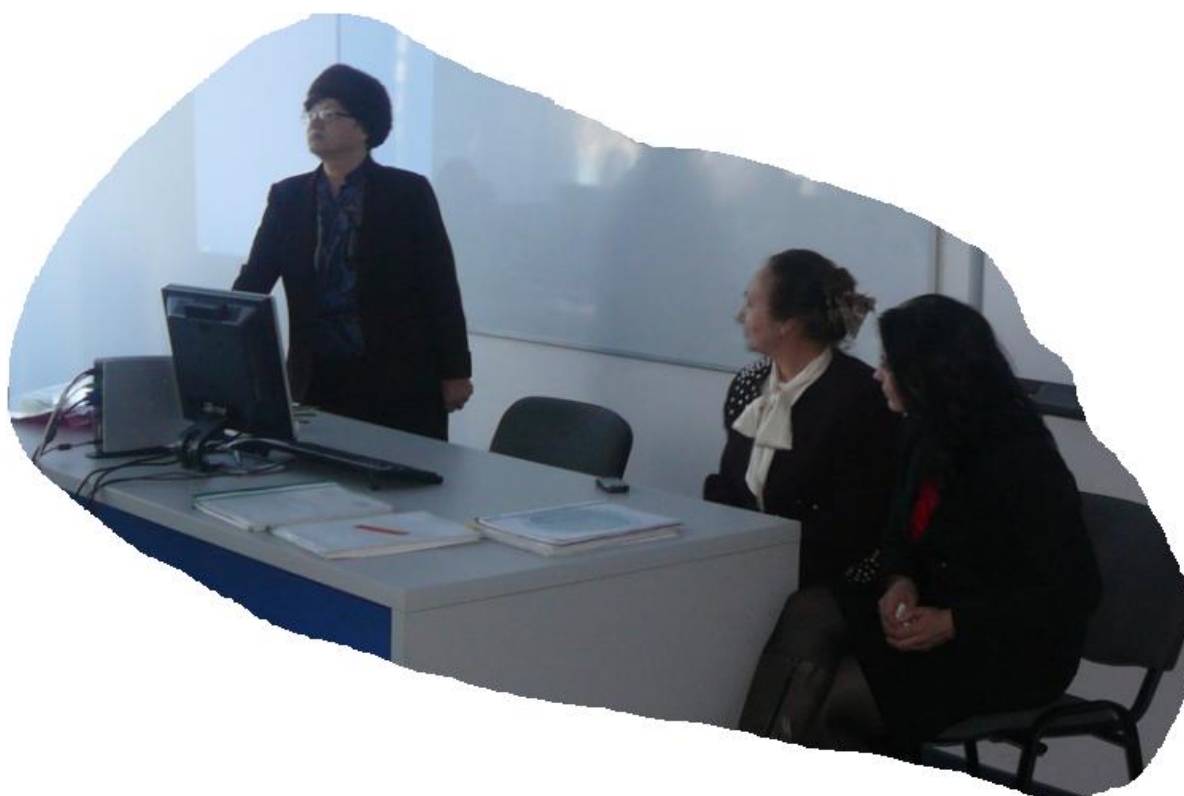
Figură 2 Workshop ( grup de lucru, atelier de lucru). 2 Și noi am lucrat mult și am reușit puțin! Ne mai lipsește „ceva”.